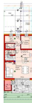
Grundriss EG Top 3